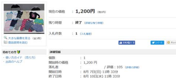
オークションサイト写真