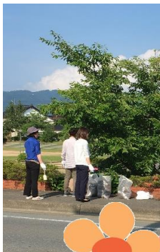
中区の皆さんと花植えしました。

ポッシュは計画相談…新規の方の計画は、慎重に慎重に。“真のニーズ”と向き合う心の余裕を持ちながらお話をさせていただきます。